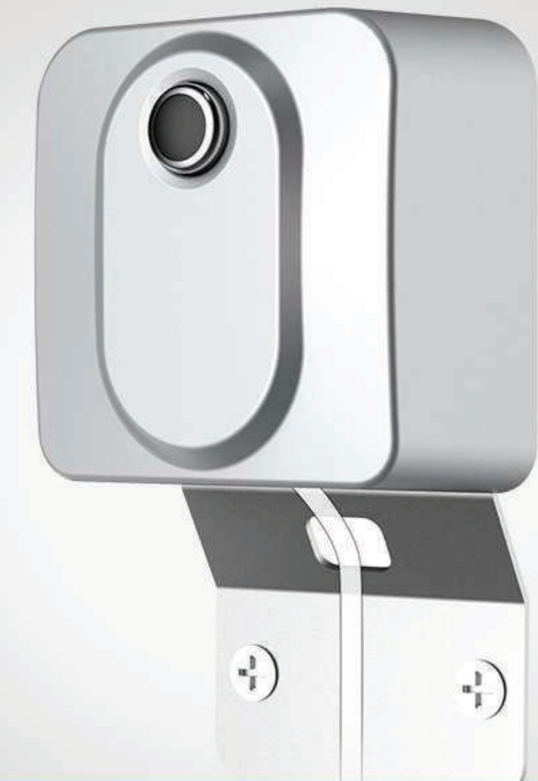
Toma de temperatura